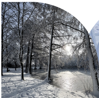
Treize-Septiers sous la neige Mardi 6 et mercredi 7 janvier 2026