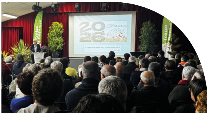
Cérémonie des vœux Jeudi 15 janvier 2026