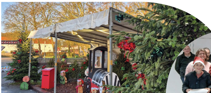
Marché de Noël Samedi 29 et dimanche 30 novembre 2025

Distribution des plateaux repas aux personnes âgées Samedi 20 décembre 2025