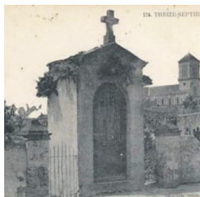
1 er oratoire 1863

Nous souhaitons poursuivre ces réunions et solliciter des bénévoles pour l'entretien des petits monuments de chaque village.