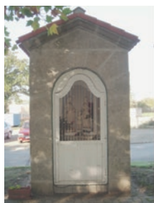
2 ème oratoire vers 2001